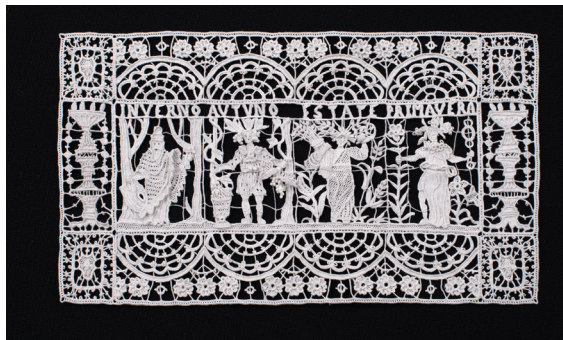
The Four Seasons

«I have had the honour to produce pieces for important art exhibitions and my latest creation has been on display in area C1, at the Centergross area at Expo Milan 2015. It is an important piece of work not only for the skills which went into producing it but because of the history that it brings with it. It is called «The Four Seasons» and was designed by Cesare Vecellio in 1601, and then reproduced by Aemilia Ars for the International